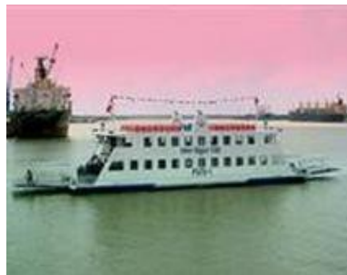
Tàu du lịch, tàu khách