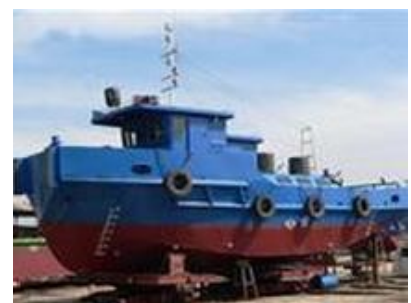
Tàu vỏ thép