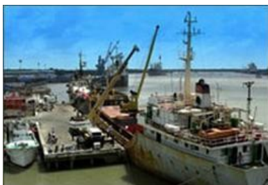
Dịch vụ cầu cảng