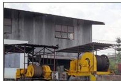
Dịch vụ lên xuống xà lan