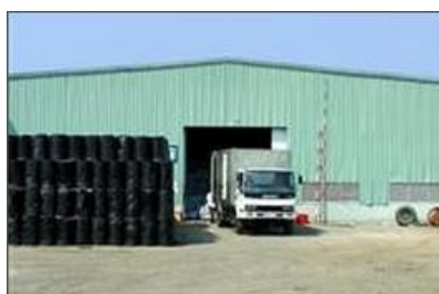
Dịch vụ kho bãi