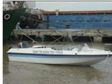
Cano Composite cao tốc