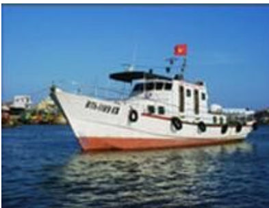
Tàu tuần tra, kiểm ngư