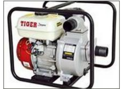
Máy xăng Máy cắt cỏ Máy bơm nước